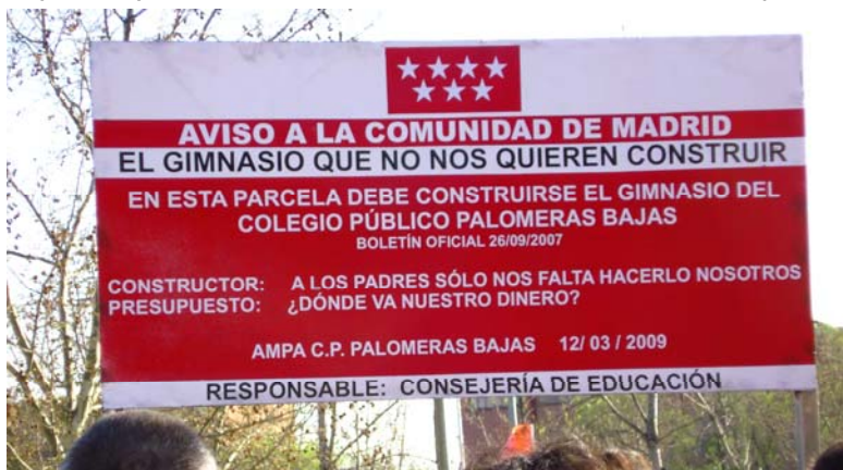
Cartel de “Inauguración de Obras” que se colocó en la concentración reivindicativa (12-03-2009). Nosotros y el barrio seguimos a falta de él